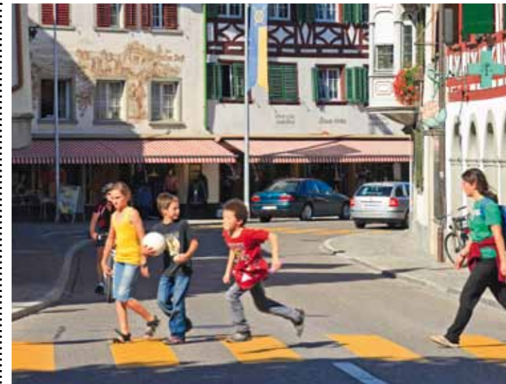
Legendig: Das Zentrum bietet mehr als schöne historische Fassaden.