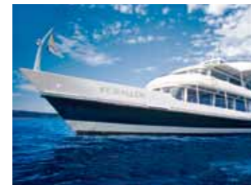
Einladend: Das Fondue-Schiff.

Leinen loswerfen und Fäden ziehen: Das Fondueschiff ab Romanshorn machts möglich. Abfahrt zum Käse-schmaus in einem ganz besonderen Ambiente ist jeweils um 19.40 Uhr (Einstieg ab 19.15 Uhr), Rückkehr um 21.55 Uhr (Liegen im Hafen bis 22.30 Uhr). Wem es nicht nach Käse is(s)t, bestellt einfach ein Fondue Chinoise. Die nächsten Daten: 16. und 17. Dezember 2011 sowie 6., 7., 14., 20., 21., 27. und 28. Januar 2012. Eine Reservation ist erforderlich. → www.sbsag.ch/sonderfahrten