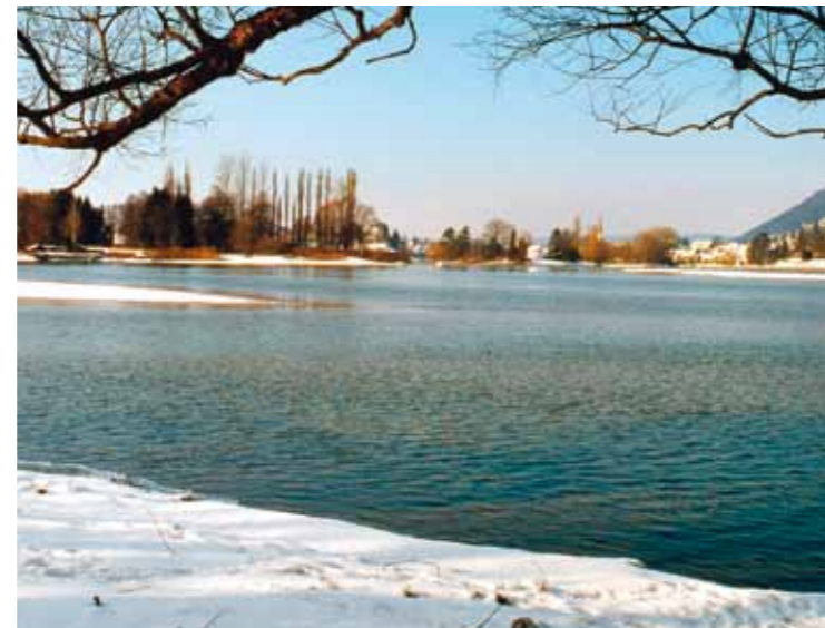
Blick von Eschenz auf die Werdinseln und Stein am Rhein.