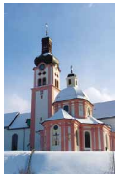
Klosterkirche mit St. Iddakapelle.

Täglich geöffnet. Restaurant: 10 bis 17 Uhr. Erreichbar mit der Buslinie 80.734, Wil–Fischingen. Nach der Schlittelfahrt: Ab Steg Linie 754 nach Winterthur und von dort zurück in den Thurgau. ➔ www.klosterfischingen.ch ➔ www.berggasthaus-hoernli.ch