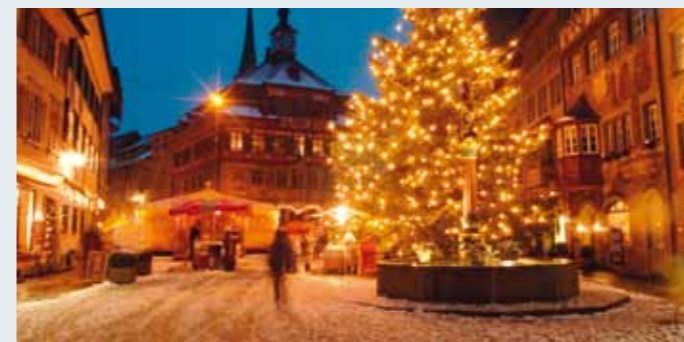
Festlicher Lichterglanz: Weihnachtsmarkt im historischen Städtchen.

Bereits auf eine zehnjährige Tradition blickt die «Märlistadt Stein am Rhein» zurück. Jeweils im Dezember verwandelt sich das Städtchen in ein Lichtermeer, und durch die Gassen führt ein Märliweg: In 25 Schau Fenstern der Ladengeschäfte wird dieses Jahr die schöne Geschichte der Frau Holle erzählt. So macht der Einkaufsbummel auch den Kindern Freude. Ein Highlight ist auch der mittelalterliche Handwerkermarkt am Wochenende vom 9. bis 11. Dezember. Im Lauf des Monats finden zudem verschiedene Konzerte statt. ➔ www.maerlistadt.ch