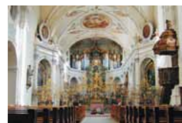
1686 erbaut: Klosterkirche.