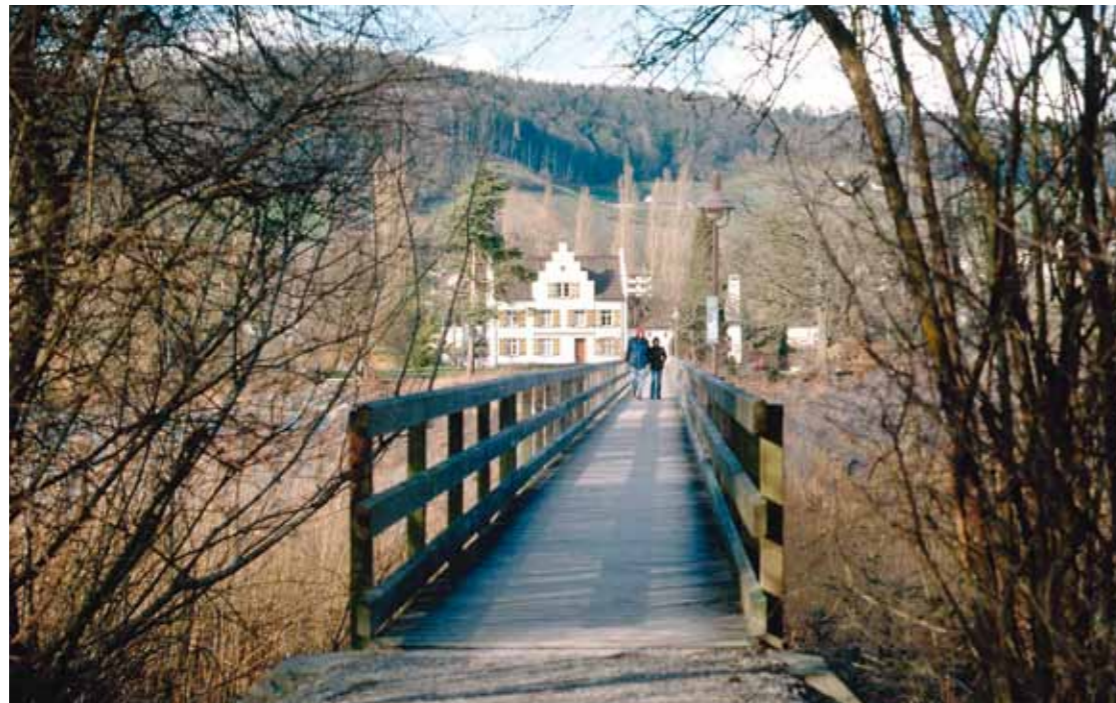
Lohnenswert: ein meditativer Abstecher auf die Insel Werd mit Franziskanerwohnhaus und St. Otmarskapelle.

In Mammern erreichen wir am weitläufigen Schlosspark vorbei den Ortskern und werfen einen Blick in die stattliche Sankt-Blasius-Kirche. Dem Namensstifter der Kirche gilt diese hübsche Legende: In den strubben Zeiten der Reformation vor bald 500 Jahren sollen Bilderstürmer auch die hölzerne Blasiusstatue aus der Kirche entfernt und in den See geworfen haben. Der hölzerne Heilige