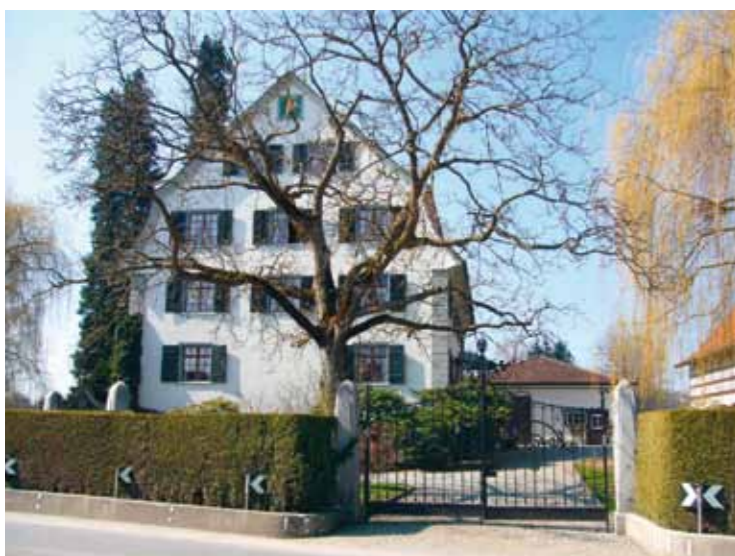
Markant: Das «Schlössli» im Langrickenbacher Ortsteil Herrenhof.

Mittwoch, Samstag und Sonntag, 10.30 bis 16.30 Uhr. Eintritt Fr. 13.– für Erwachsene, Kinder Fr. 6.–. Ab Romanshorn mit Bahnlinie 870, ab Frauenfeld mit den Bahnlinien 841 (Frauenfeld – Wil) und 853 (Wil – Neu St. Johann). Ab Bahnhof Lichtensteig 15 Minuten zu Fuss, ab Bahnhof Wattwil mit Buslinie 80.770 bis Lichtensteig Hof und 3 Minuten zu Fuss. ➔ www.erlebniswelttoggenburg.ch