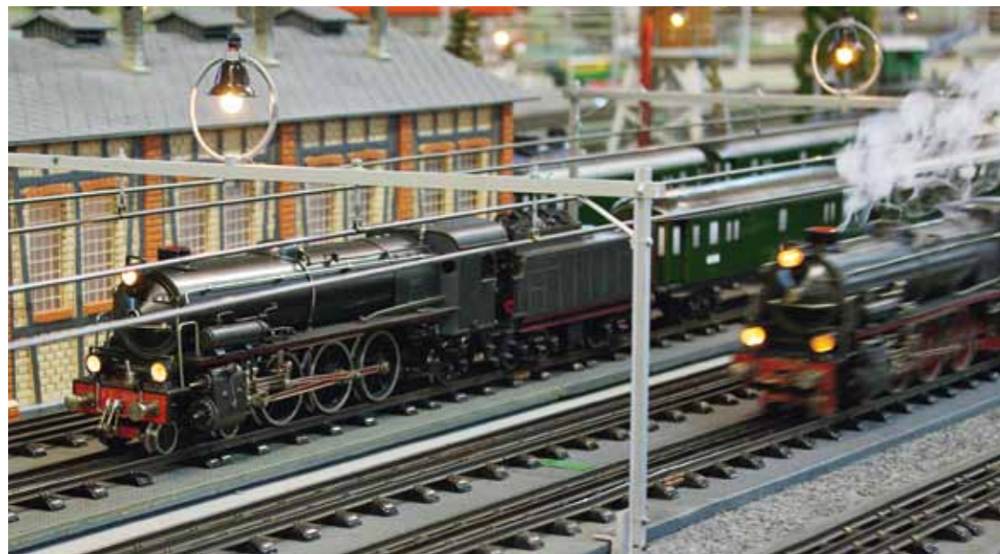
Als die Lokomotiven noch Dampf ablassen durften: Modellbahnzüge in voller Fahrt.