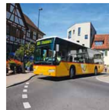
Es läuft rund bei Steckborns ÖV.