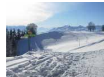
Ideal zum Schneeschuhlaufen.

Dem (nebel-)grauen Alltag entfliehen und die märchenhafte Winterlandschaft rund um den St. Anton mit Ausblick auf den Bodensee, den Alpstein bis hin zu den Bündner Alpen genießen: Wer im Postauto anreist und eine Fahrbestätigung abgibt, geniesst gratis einen Appenzeller Desserteller im Wert von 11 Franken. – Das ist bloss einer von 24 Winter-Freizeit-tipp von PostAuto und Thurbo. Mehr Infos am Bahnhof oder im Internet. → www.postauto.ch , Webcode 10524 → www.turbo.ch/freizeit