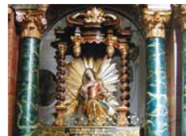
Lindert Fusschmerzen: Heilige Idda.