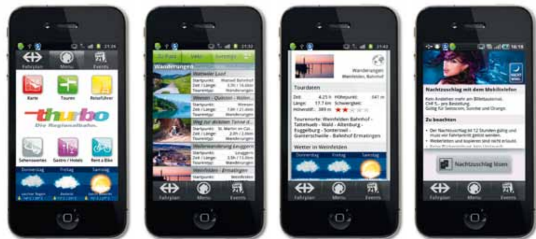
Ob Wanderführer oder mobiler Ticketautomat: Die Turbo-Freizeit-App bietet eine Fülle von nützlichen Funktionen.

Touren und Ausflüge – ganz einfach mit dem Handy: Der neue Turbo-Reiseführer machts möglich.